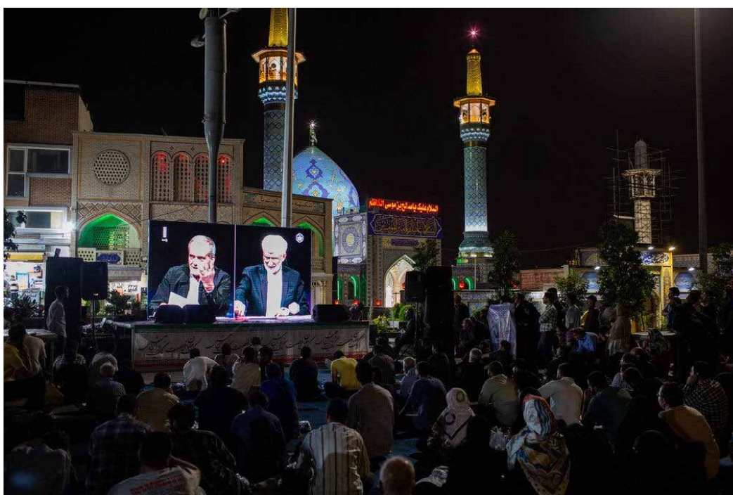
Masoud Pezeshkian, left, and Saeed Jalili, right, on a big screen during the last presidential debate in Tehran, on Tuesday.

While Dr. Pezeshkian received the most votes in the first round, it's unclear who will emerge on top on Friday. The third-place candidate, Mohammad Baqer Ghalibaf, who received 13.8 percent of first-round votes, endorsed Mr. Jalili, but earlier polling showed that many of Mr. Ghalibaf's supporters would not support Mr. Jalili. Here is what to know about Dr.