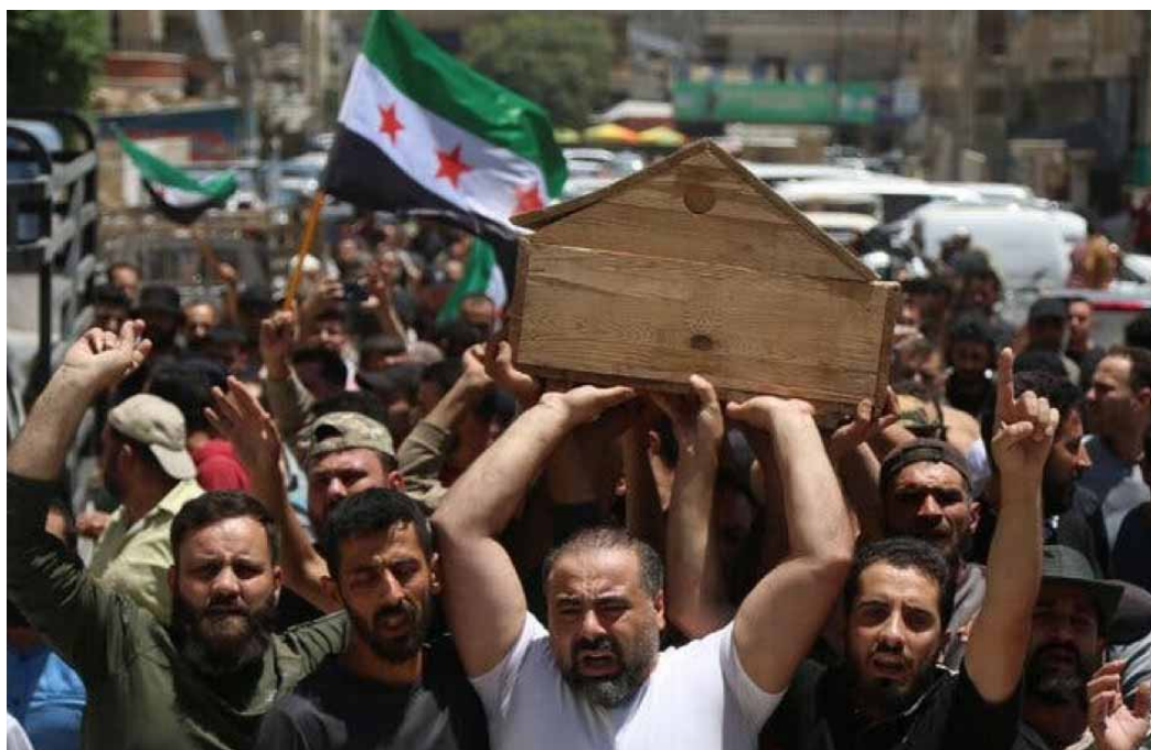
In Afrin, Syria, mourners carried the coffin of a man killed during protests against Turkey.

And many Syrians who oppose the government of President Bashar al-Assad have gone from viewing Turkey as their greatest protector to fearing that it will abandon them. Support for the idea of sending Syrian refugees home has spread across Turkey's political spectrum.