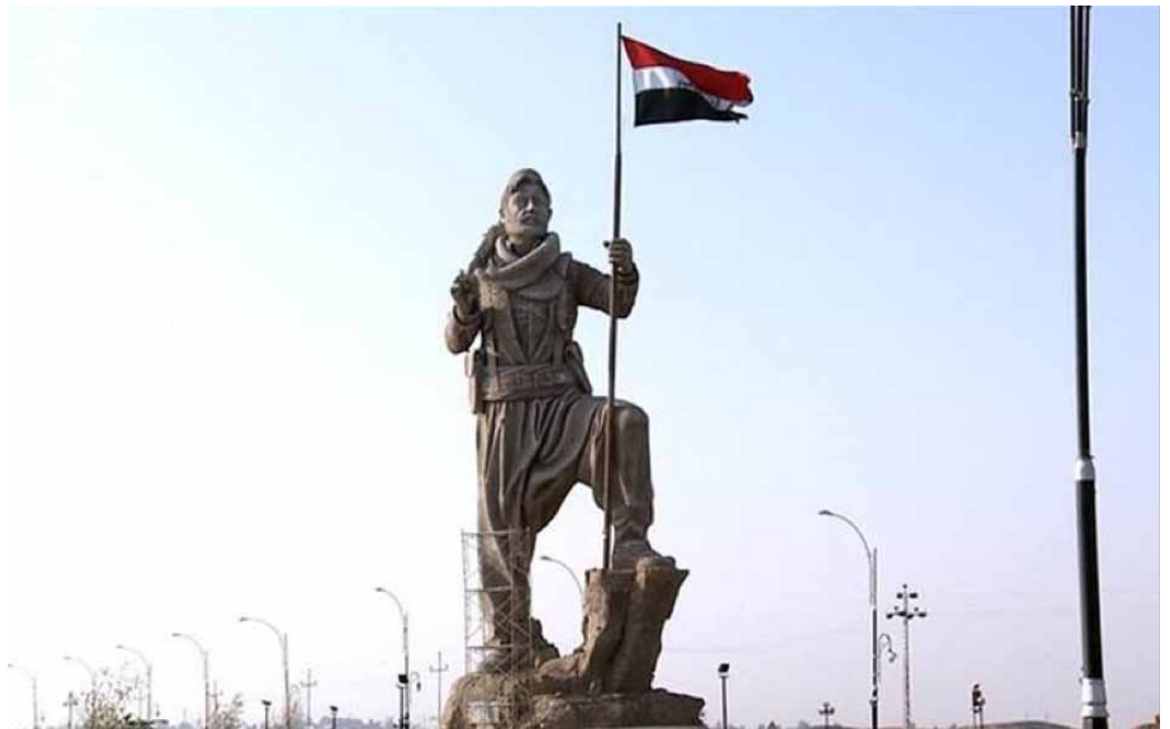
The Iraqi flag replaced the Kurdistan one on Kirkuk's Peshmerga statue, guarding over the northern gate to the city, when Iraqi forces took over control of the city in October.

Fatih, also a member of Patriotic Union of Kurdistan