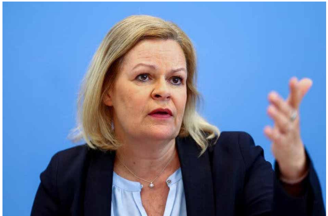
Nancy Faeser, Germany's interior minister, accused the I.Z.H. of promoting Islamic extremism.

Her ministry said the authorities had begun court-ordered searches of 53 properties linked to the I.Z.H. across Germany, including in Berlin and Hamburg, and were seizing the organization's assets. The government will also shut down four Shiite mosques, including what is known as the