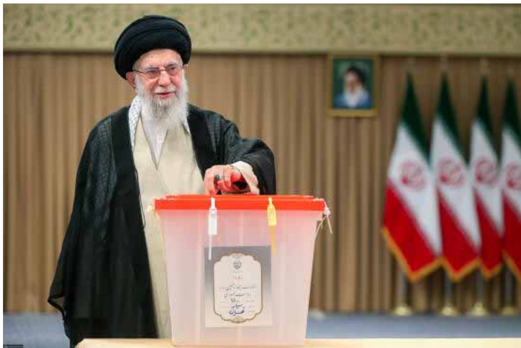
Le Guide suprême de la République islamique, l'ayatollah Ali Khamenei, vote lors de l'élection présidentielle à Téhéran, en Iran, le 5 juillet 2024.

Lors de deux débats, les deux candidats ont abordé les difficultés économiques du pays, ses relations internationales, le faible taux de participation aux élections et les restrictions imposées à Internet par le gouvernement. « Les gens sont mécontents de nous », les responsables, a déclaré M. Pezeshkian. « Lorsque 60 % de la population ne participe pas [à une élection], cela signifie