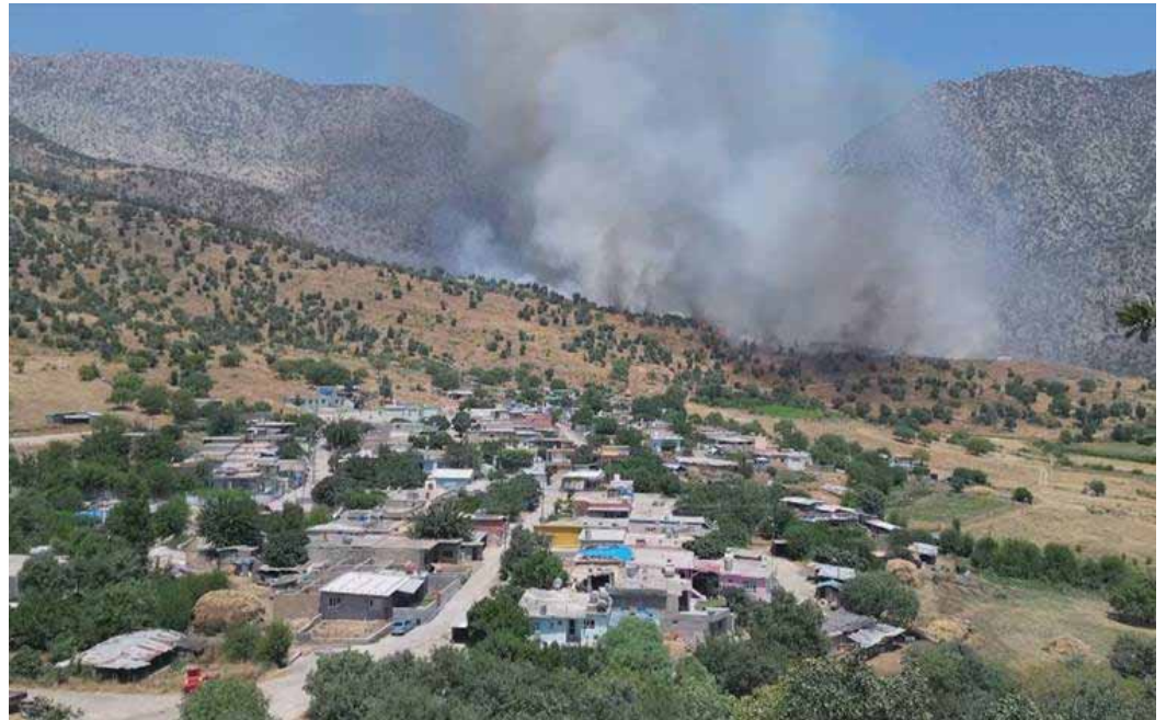
A fire in the vicinity of a Duhok village caused by Turkey-PKK fighting on July 4, 2024.

Turkey has deployed a large number of troops to the Kurdis-