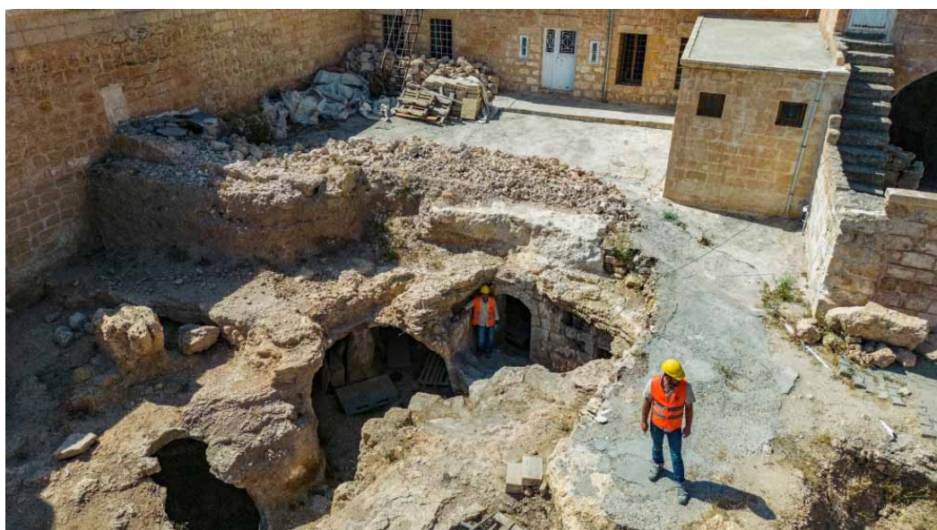
Le site archéologique de Matiate sous la ville de Midyat, dans la province de Mardin, dans le sud-est de la Turquie, le 1er juillet 2024, Yasin AKGUL

En fait, on en soupçonnait l'existence : le sol s'était effondré et un engin de chantier était tombé dans les années soixante-dix. Mais à l'époque