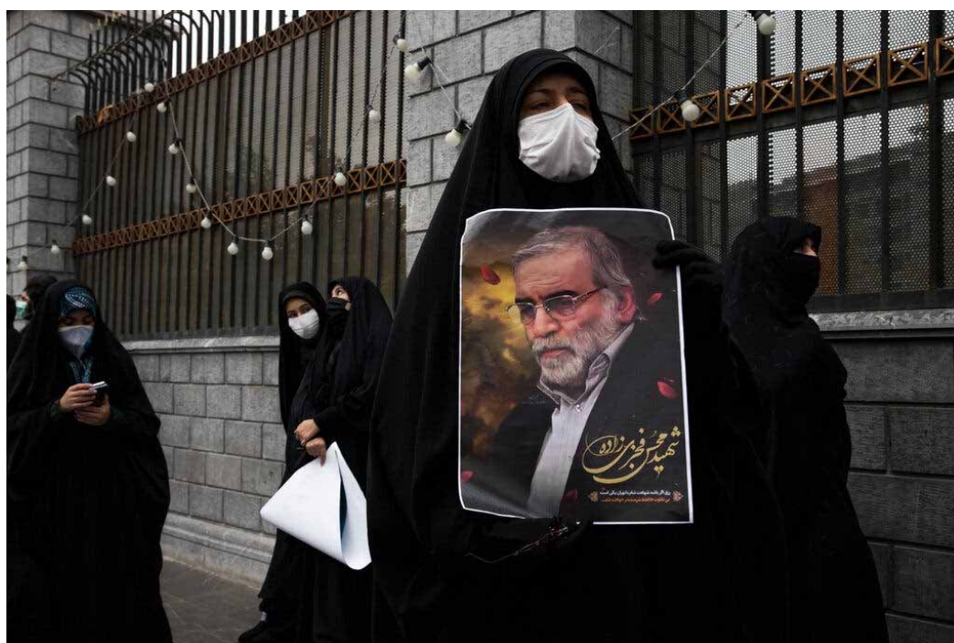
Iran accused Israel of killing Mohsen Fakhrizadeh, a scientist described as a leading figure in its nuclear weapons program, in 2020.

He wasn't the first scientist linked to the nuclear program