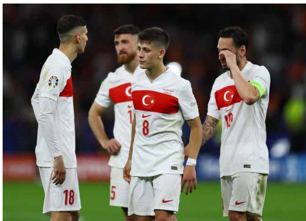
Les joueurs turcs après leur élimination en quart de finale de l'Euro contre les Pays-Bas, au Stade olympique de Berlin, le 6 juillet 2024.

Recep Tayyip Erdogan, qui était alors premier ministre de la Turquie, avait assisté à Vienne au quart remporté par son pays face à la Croatie (1-1, 3-1 t.a.b.). Le désormais président était à nouveau présent, samedi, et espérait porter chance aux joueurs de la sélection. Sa venue à Berlin n'était initialement pas prévue, mais le dirigeant