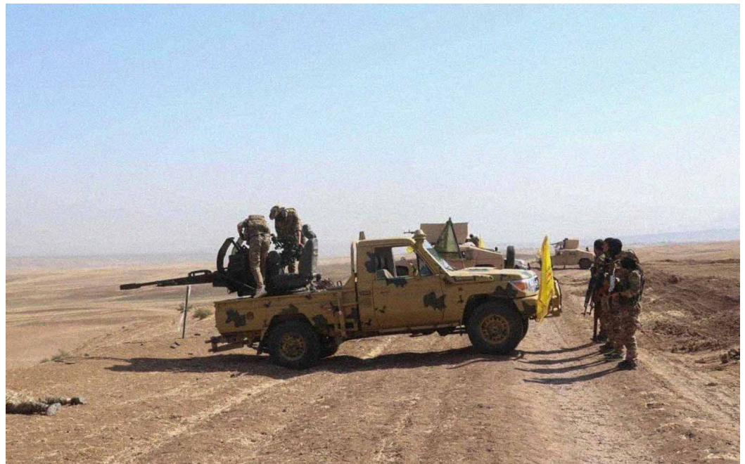
Members of the Syrian Democratic Forces.

Though the jihadists no longer control any territory, they continue to pose a security risk by carrying out kidnappings, hit-and-run attacks, and bombings, and the Syrian Democratic