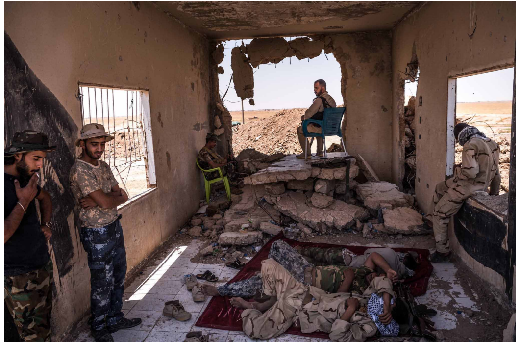
Members of the Popular Mobilization Forces, a mostly Shiite militia group, at their post at the Iraqi border with Syria in 2017.

Last week, in the latest round of discussions in Washington on a reconfiguration of the military relationship, Iraq called for a drawdown of the U.S.-led multinational force within about a year, underscoring its determination to thin out the American presence.