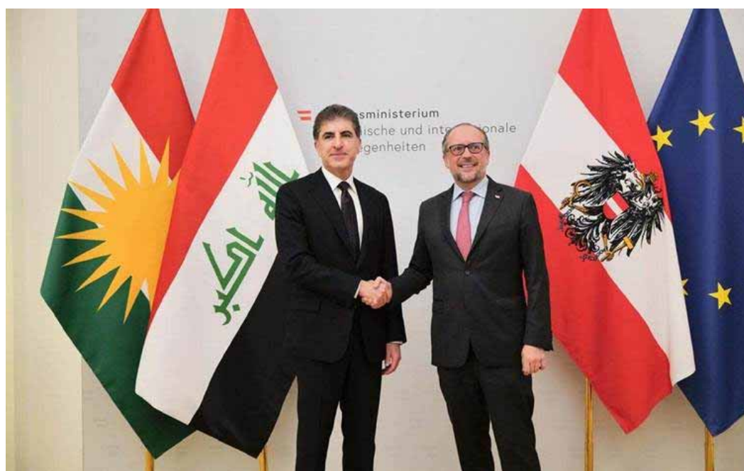
Kurdistan Region President Nechirvan Barzani (left) shakes hands with Austrian Foreign Minister Alexander Schallenberg in Vienna on July 2, 2024.

“Yes there is a [commercial] office now, but we are eye-