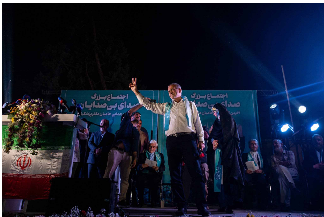
The winner of Iran's presidential runoff, reformist candidate Masoud Pezeshkian, on the last day of campaigning in Tehran last week.

be to tackle inflation, which has sent the prices of fresh fruit, vegetables and meat up sharply.