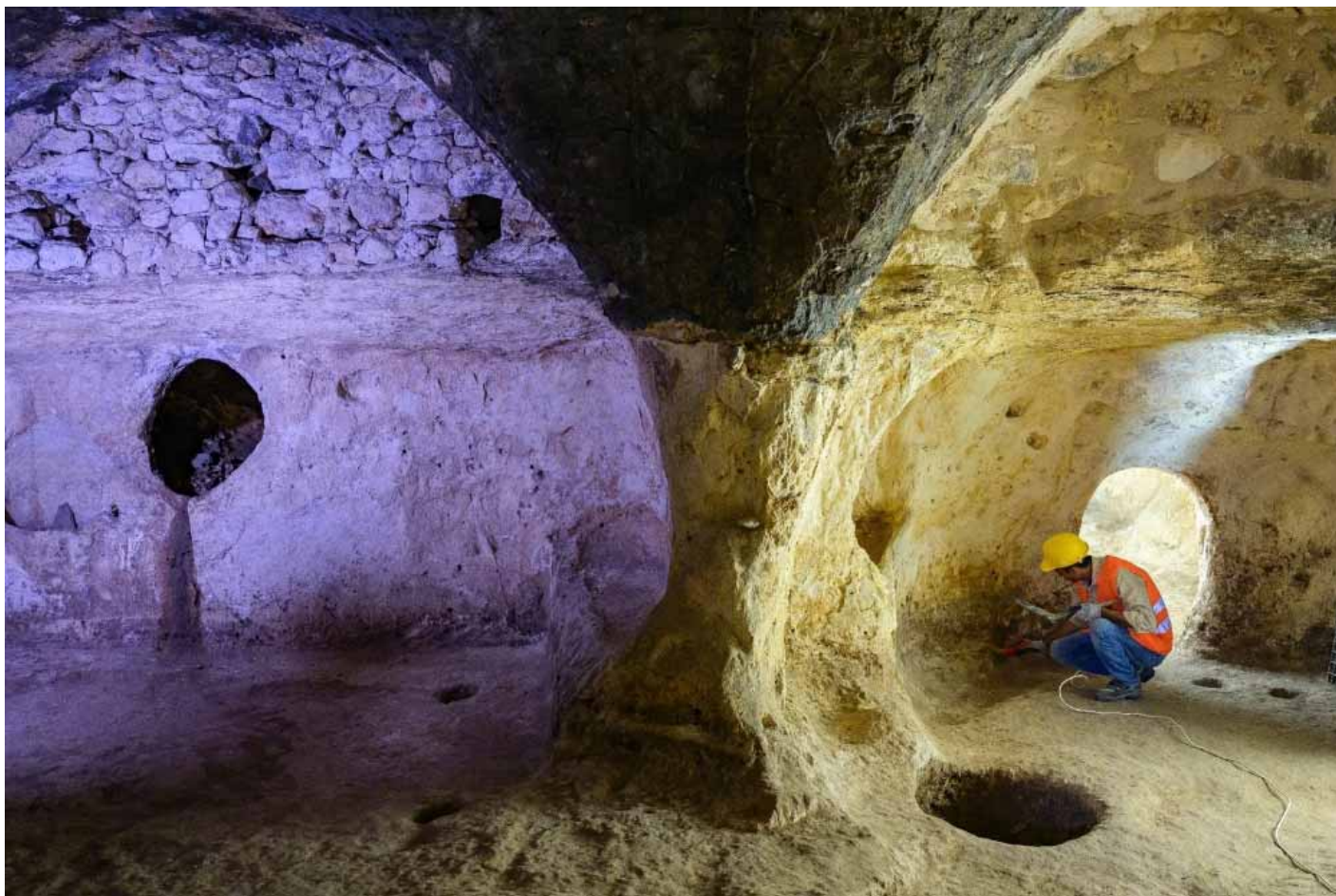
Le site archéologique de Matiate sous la ville de Midyat, dans la province de Mardin, dans le sud-est de la Turquie, le 1er juillet 2024

on n'a pas cherché à en savoir plus, on a étayé et refermé.