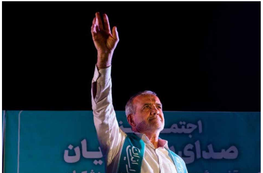
Masoud Pezeshkian waving to supporters at a campaign rally in Tehran on the last day of campaigning on Wednesday.

"The difficult path ahead will not be smooth except with your companionship, compassion and trust," Mr. Pezeshkian wrote on social media after his win. In another post, he thanked the