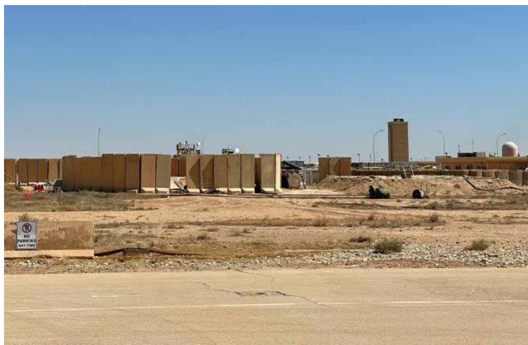
La base aérienne d'Ain Al-Asad qui accueille les forces américaines en Irak, dans la province occidentale d'Al-Anbar, le 8 juillet 2021.

Le Hachd Al-Chaabî, coalition de milices pro-iraniennes, dont certains groupes ont mené de nombreuses attaques contre