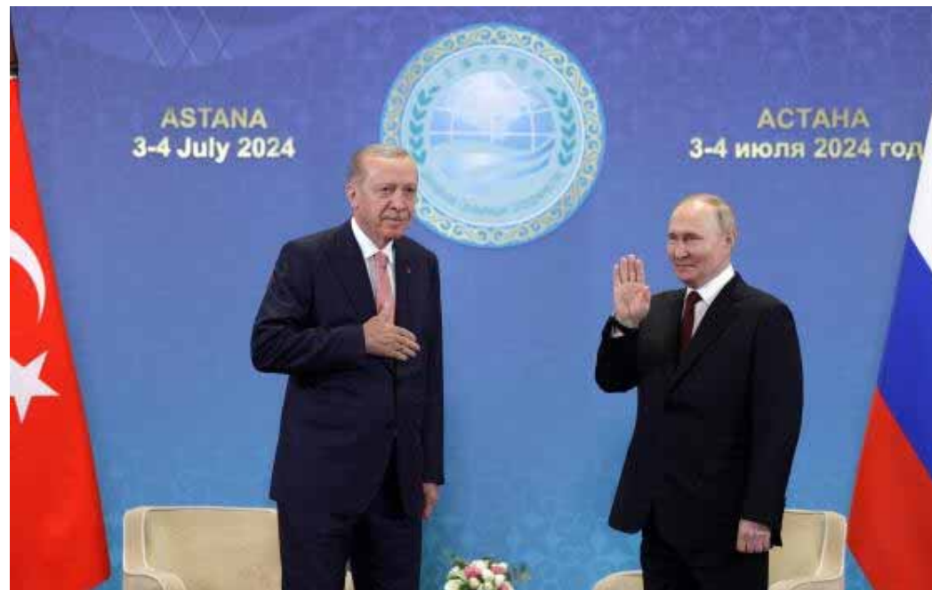
Rencontre entre les présidents turc, Recep Tayyip Erdogan, et russe, Vladimir Poutine, au sommet de l'Organisation de coopération de Shanghai, à Astana, le 3 juillet 2024.

C'est ce qu'il a expliqué le 31 mai à des médias turcs, précisant que MM. Erdogan et Assad y étaient favorables. Proche de la Syrie et de l'Iran, M. Al-Soudani, qui cherche à renforcer sa stature internationale en se posant en médiateur, pense pouvoir réussir là où les diplomates russes ont échoué. La médiation russe avait achoppé en 2023, après deux ans d'efforts, face à l'exigence posée par le président Al-Assad,