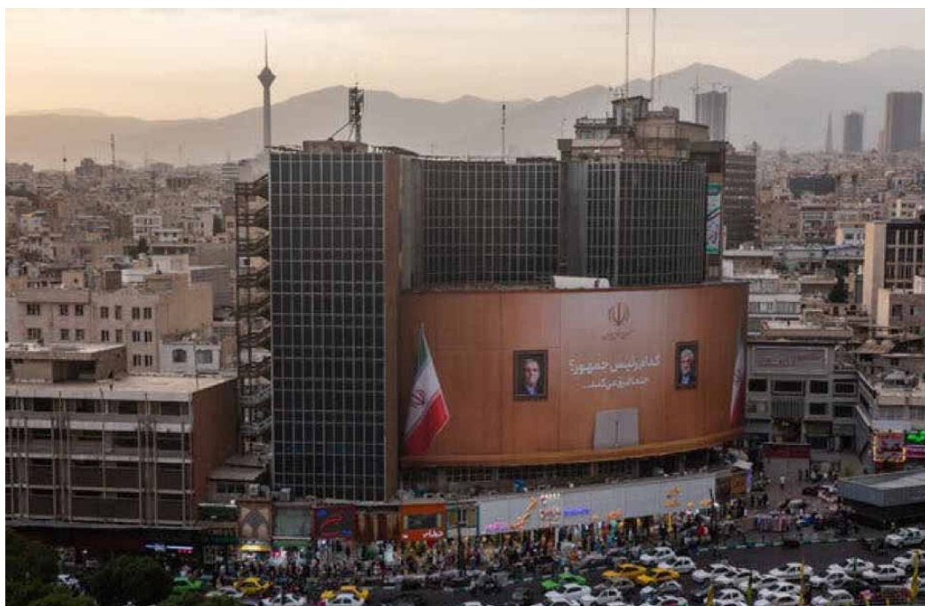
A billboard in Tehran featuring pictures of the reformist candidate Dr. Masoud Pezeshkian, left, and the ultraconservative Saeed Jalili.

Experts said Dr. Pezeshkian would most likely increase voter turnout among reformist party supporters and people