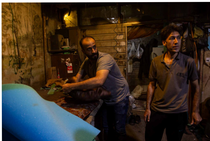
Many workers, like these furniture restorers in Tehran, say they make too little to build a life. Some contemplate emigrating to Europe.

"Just look down the street," he said. "Business is awful. There are no customers, people are economically weak now, they don't have money."