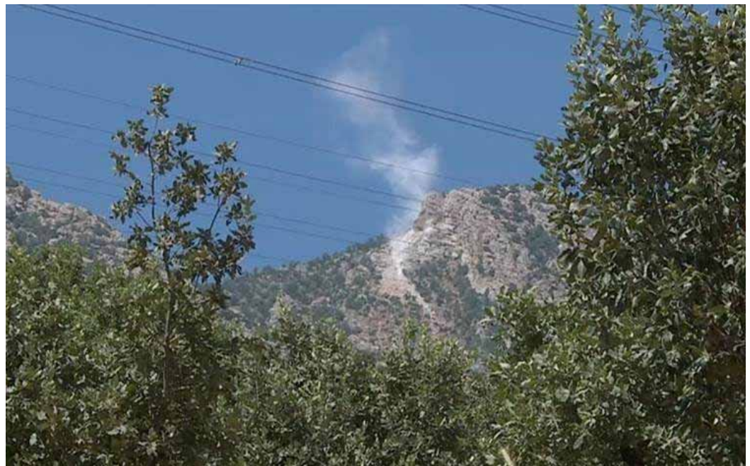
Bombardment of a mountain in Duhok province on July 3, 2023.

In June, farmers and livestock breeders from the Sidakan district were forced to relocate from the cooler highlands, which are ideal for farming and grazing, due to Turkish bombardments of the Kurdistan