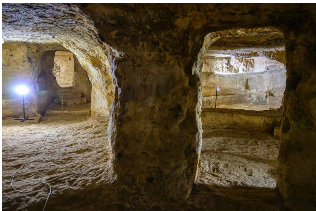
Le site archéologique de Matiate sous la ville de Midyat, dans la province de Mardin, dans le sud-est de la Turquie, le 1er juillet 2024