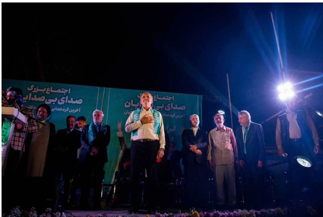
Masoud Pezeshkian at a rally in Tehran on the last day of campaigning before the election. He ended up winning in an upset.