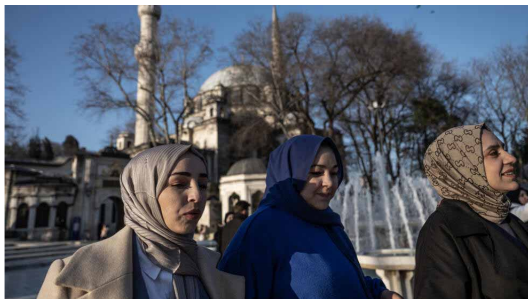
En Turquie, une proposition de loi impose aux femmes de prendre obligatoirement le nom de leur époux. (Image d'illustration)

La proposition de loi déposée au Parlement turc reprend quasiment mot pour mot les termes de l'ancien article. Selon le pouvoir, les femmes devraient toujours porter le patronyme de leur mari au nom de « l'intégrité de la famille » et de la protection des enfants.